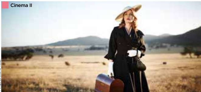
A Vingança está na moda