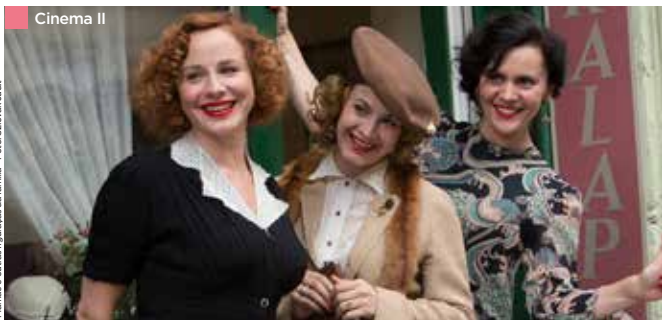
Mamãe e outras figuras da família

Programação no fôlder da mostra e no site do CCBB. Classificação e duração de acordo com o filme.