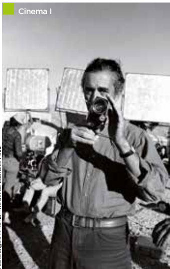
Foto: Michelangelo Antonioni no Set de Zabriskie Point