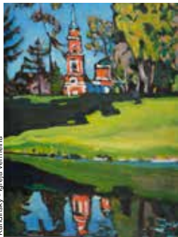
Kandinsky - Igreja Vermelha

Cinema Easy Riders, O Cinema da Nova Hollywood