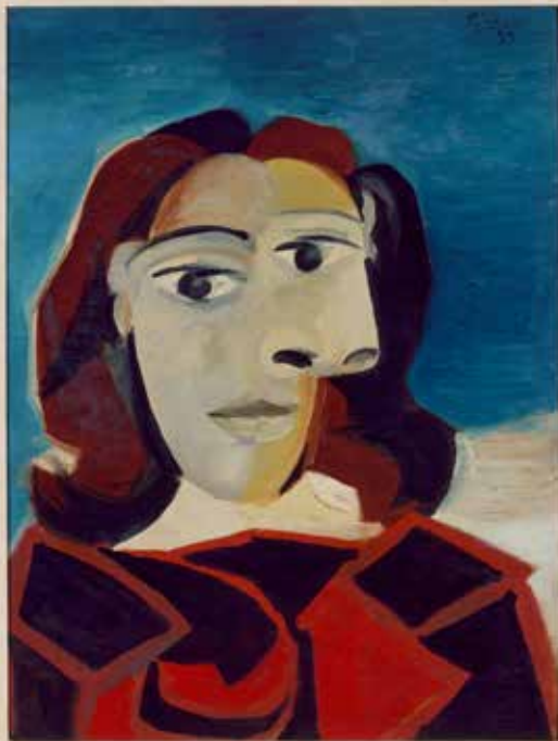
Pablo Ruiz Picasso, Retrato de Dora Maar, 1939, Óleo sobre madeira (60 x 45 cm), Coleção do Museo Nacional Centro de Arte Reina Sofia, Madrid © Succession Pablo Picasso / AUTVIS, Brasil, 2015.

PICASSO E A MODERNIDADE ESPAÑHOLA Até 7/9