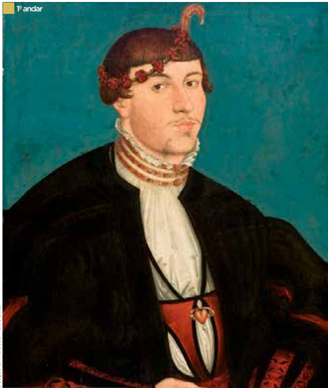
Lucas Cranach, o Antigo, 1472 - Weimar, Alemanha, 1553. Retrato de jovem aristocrata — Um jovem noivo da família Rava, 1539. Doação família Sotto Maior, 1950;